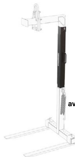
avec KM 414