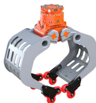
optionale 4-Grip Ansteckvorrichtung mit D09HPX